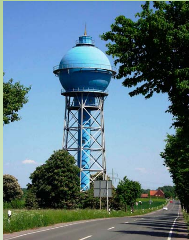
Der „Blaue“ Wasserturm an der Guissener Straße in Ahlen

Auf Wunsch organisieren wir für Sie auch eine Stadtführung oder auch eine Führung über das ehemalige Gelände der Steinkohlenzeche Westfalen.